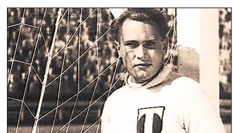
Кадр из фильма «Вратарь» (1936)

По сути, первый художественный советский фильм о футболе. История про Антоня Кандидова , который работал грузчиком, ловко ловил арбузы, а затем попал в команду «Гидраэр».