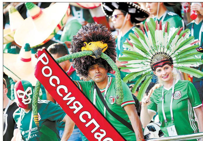
«Россия, спасибо!» – с такими плакатами на русском языке мексиканцы пришли сегодня на матч в Екатеринбурге, чтобы выразить благодарность за гостеприимство

Мексиканцы же отгрызались, но тоже до опасных моментов дело не доходило. Пару раз Карлос Вела пальнул мимо ворот, и пожалуй, всё. Одним из самых запоминающихся моментов матча стал видеопромоутор. Чичарито сыграл рукой в своей штрафной площадке, но арбитр, посмотрев повтор, пенальти не назначил.