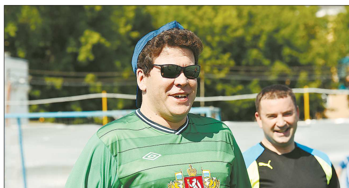
Два года назад Денис Мацуев выступил в роли футбольного легионера – сыграл за команду правительства Свердловской области

– 32-й раз я здесь, практически это мой второй дом, и от этого ответственнее каждый выход на сцену моей любимой Свердловской филармонии. Нынешний фестиваль проходит уже в третий раз, главная его идея – это отбор молодых талантов со всей области. Приглашают профессора из Московской консерватории, проводят мастер-классы, по итогам мы отбираем в нашу семью «Новых имён» питомцев из вашего