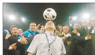
Кадр из фильма «Марадона» (2008)

стрица смог без сглаживания острых углов рассказать о судьбе футболиста, который то падал на самое дно, то возносился фанатами до небес.