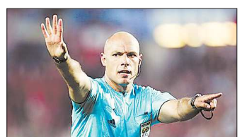
Кадр из фильма «Арбитры» (2009)