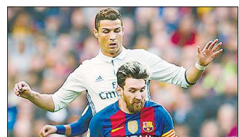
Кадр из фильма «Роналду против Месси» (2018)

кто за Криштиану Роналду , и тех, кто болеет за Лионеля Месси .