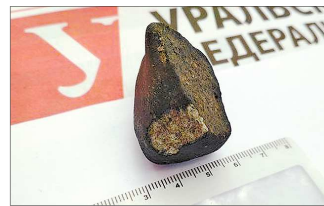
Один из трёх найденных осколков