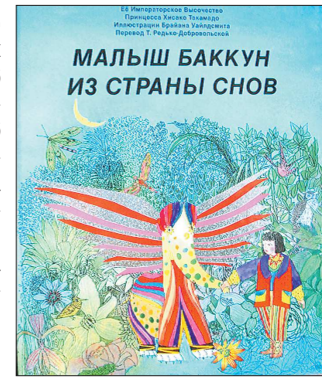
Мальчик Баккун из страны снов