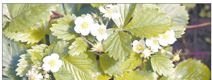
Несмотря на холодное лето, урожай земляники обещает быть не хуже прошлогоднего

В парниках и теплицах обрабатывать овощи и цветы можно в любое время. А прежде чем использовать стимуляторы для растений в открытом грунте, посмотрите прогноз погоды, – предупредил наш собеседник. Поливать или опрыскивать накануне дождя и в сильный ветер бессмысленно: препарат смывает или сдуется.