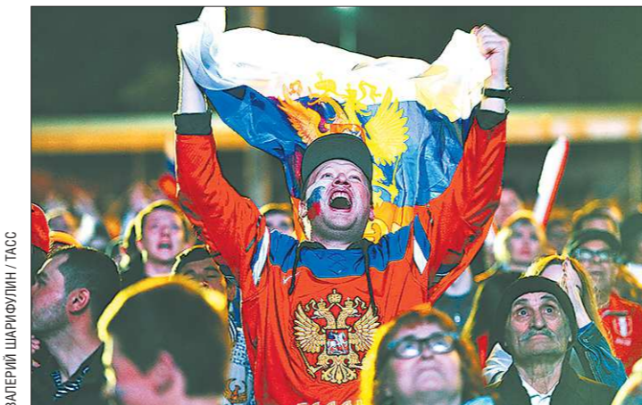
А вот так каждому голу радовались екатеринбургские болельщики в фан-зоне