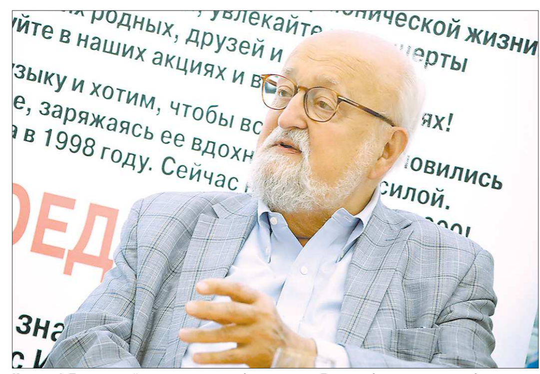
Кшиштоф Пендерецкий отметил, что если бы он пожил в Екатеринбурге, то посвятил бы городу музыкальное произведение

Вчера в Свердловской филармонии состоялся авторский концерт Кшиштофа Пендерецкого. Живописный классик, один из величайших композиторов современности, дирижировал Уральским филармоническим оркестром и Симфоническим хором.