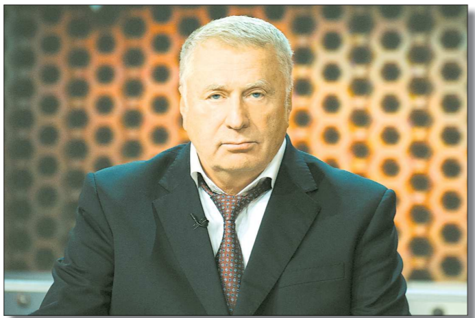
Жириновский знает, как защитить граждан России

«Тогда, в 1993 году, мы создали новое юридическое полотно, по