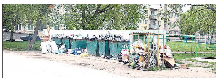
Мусор на контейнерных площадках копится, но вывезти его не успевают