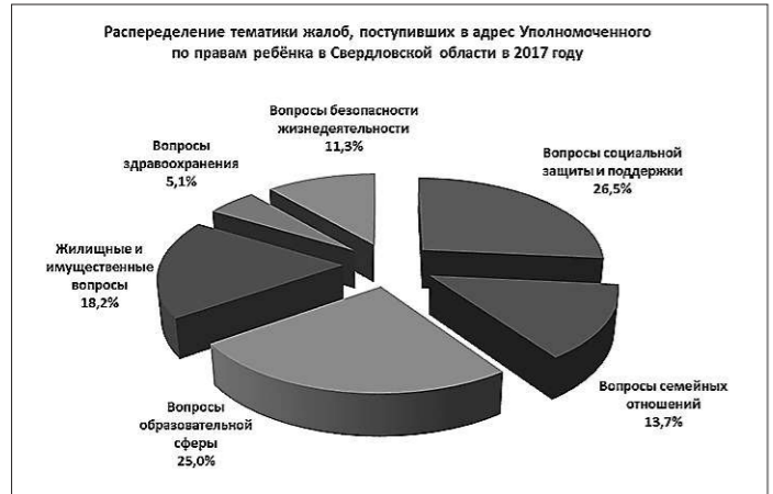
Рис. 6. Структура тематик обращений граждан

Структура тематик обращений граждан и организаций в отчетном году отражена в приведённой ниже диаграмме (рис. 6).