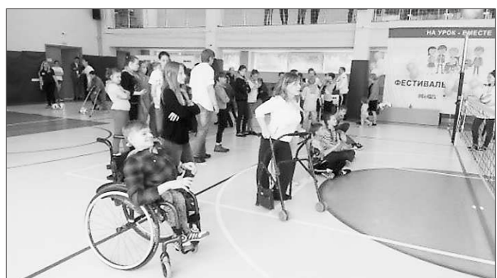
Фото 25. На Фестивале параспорта.

Спорт — не единственная сфера отношений, формирующая детскую личность. Самой важной, основной и, по сути, первоестественно значимой остается семья: отношения внутри семьи, родительская и детская любовь, чувство локтя с братьями и сестрами и общее совместное решение жизненных проблем с которыми сталкиваются члены семьи. В течение всего года Уполномоченным давались комментарии представителям средств массовой информации по поводу оптимального разрешения различных внутрисемейных и внутрискольных конфликтов, спорных ситуаций и столкновений отдельно взятых граждан с представителями исполнительных органов власти; решались сложные жизненные ситуации обратившихся заявителей; комментировались на официальном сайте Уполномоченного актуальные и неоднозначные события и инициативы, направленные на формирования благополучного детства.