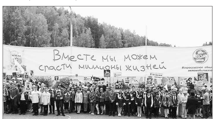
Фото 24. Открытие областных соревнований юных велосипедистов.

В июле в Областном центре реабилитации инвалидов прошёл «Фестиваль параспорта», организованный в Екатеринбурге ассоциацией «Особые люди» (фото 25). Фестиваль прошёл в рамках федерального социального проекта «На урок — вместе», который направлен на развитие инклюзии в обществе. В рамках данного проекта эксперты проводят для преподавателей школ обучающие семинары и тренинги по методам включения детей с инвалидностью в общеобразовательный процесс.