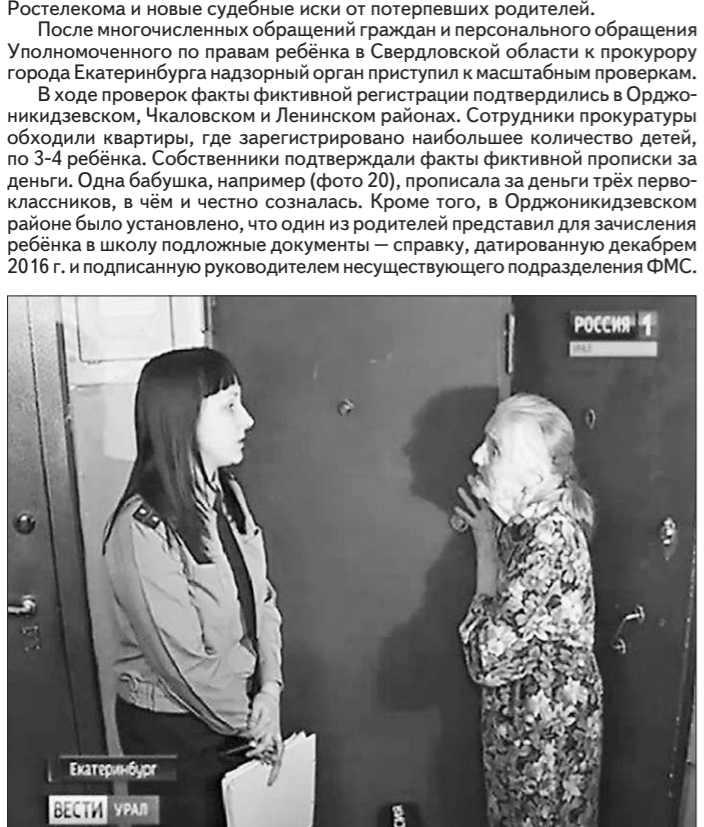
Фото 20. Честно сознавшаяся бабушка.

После многочисленных обращений граждан и персонального обращения Уполномоченного по правам ребёнка в Свердловской области к прокурору города Екатеринбурга надзорный орган приступил к масштабным проверкам. В ходе проверки факты фиктивной регистрации подтвердились в Орджоникидзевском, Чкаловском и Ленинском районах. Сотрудники прокуратуры обходили квартиры, где зарегистрировано наибольшее количество детей, по 3-4 ребёнка. Собственники подтверждали факты фиктивной прописки за деньги. Одна бабушка, например (фото 20), прописала за деньги трёх первоклассников, в чём и честно созналась. Кроме того, в Орджоникидзевском районе было установлено, что один из родителей представил для зачисления ребёнка в школу подложные документы — справку, датированную декабрем 2016 г. и подписанную руководителем несуществующего подразделения ФМС.