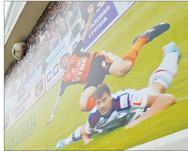
Фотография-обложка выставки «ОГ» сделана объёмной – прямо на снимок прикреплён мяч, который как бы вылетает с изображения в реальную жизнь – прямо на проспекте Ленина

На выставке мы представляем не только международный проект, но и историю уральского футбола в новой России. ФК «Урал» проделал большой путь от восстановления из разлуки до элитного российского дивизиона. Сейчас нужно ставить более амбициозные задачи. Как сказал губернатор Евгений Куйвашев, пора мечтать о еврокубках. Это нашей команде уже под силу. И вторая задача нашей выставки – поддержать «Урал» и привлечь ещё больше болельщиков на игры команды на новом шикарном стадионе.