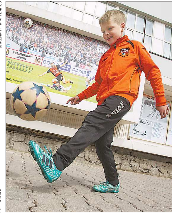
Церемонию открытия фотопроекта посетили воспитанники детской спортивной школы «Урал-2008». Ребята показали навыки владения мячом