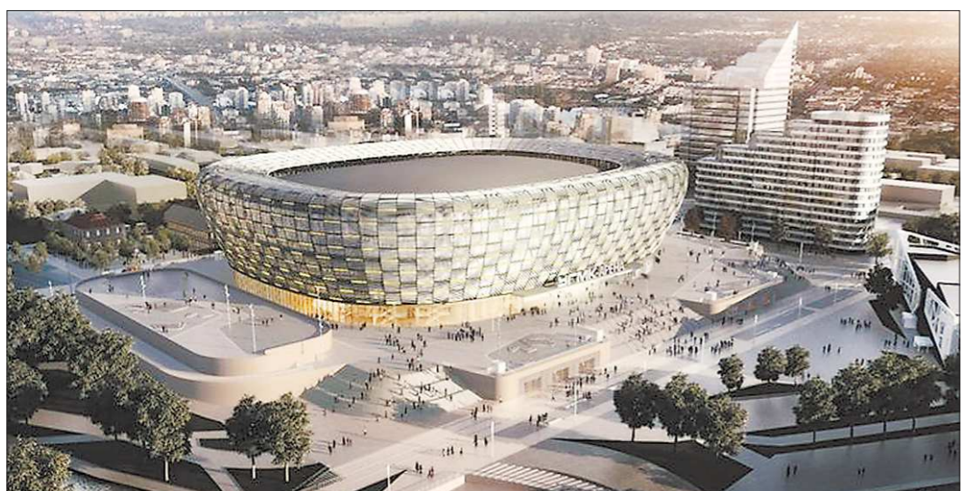
На градсовете УГМК-Холдинг представили базовый вариант оформления фасада арены, который будет дорабатываться