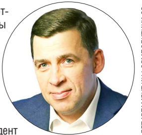
ДЕПАРТАМЕНТ ИНФОРМАТИКИ СО

Губернатор Свердловской области Евгений КУЙВАШЕВ