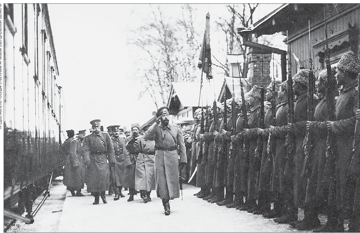
Перрон в городе Могилёв, где находилась Ставка. Почётный караул, группа генералов и офицеров встречают Николая II и сопровождающих его лиц, прибывших императорским поездом. Осень 1915 года

В Екатеринбурге определили приоритеты по увековечиванию памяти последнего российского императора Николая II