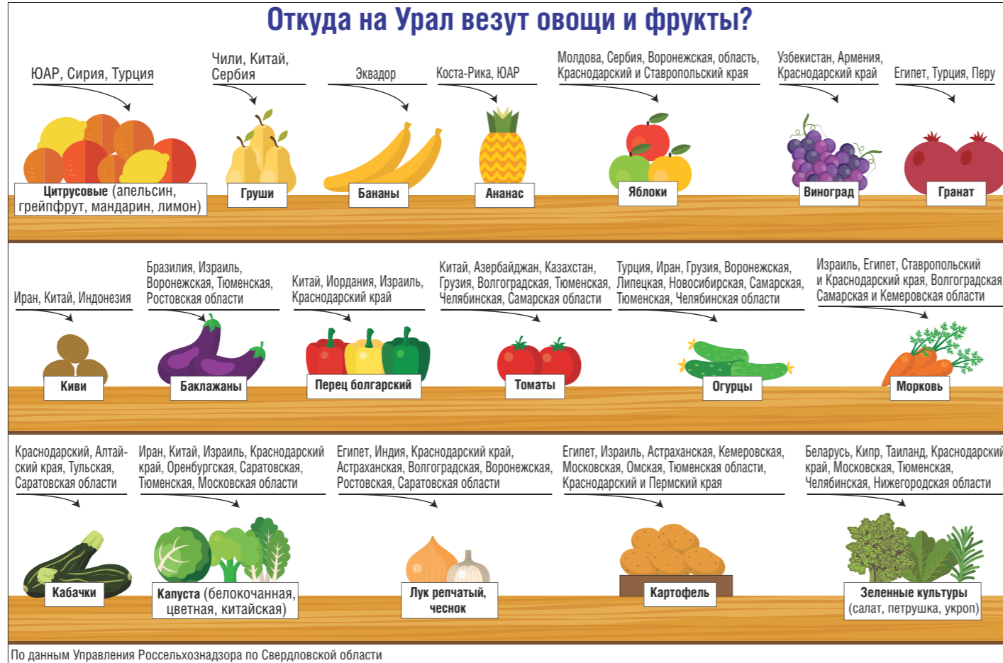
По данным Управления Россельхознадзора по Свердловской области

Фрукты и овощи завозятся в Свердловскую область в соответствии с контрактами, заключёнными между регионом и поставщиками. Любая торговая сеть имеет своё подразделение и менеджеров, следящих, чтобы почти весь ассорти-