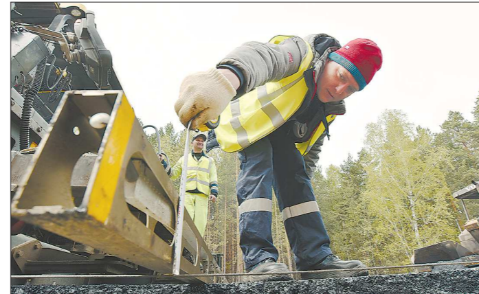
Толщину слоя органоминеральной смеси при укладке замеряют рулеткой

Органоминеральная смесь хорошо скрепляет частично повреждённую бетонную конструкцию, равномерно передаёт нагрузку и обеспечивает устойчивость к образованию таких деформаций, как колеи и трещины, – пояснил вчера журналистам главный ин-