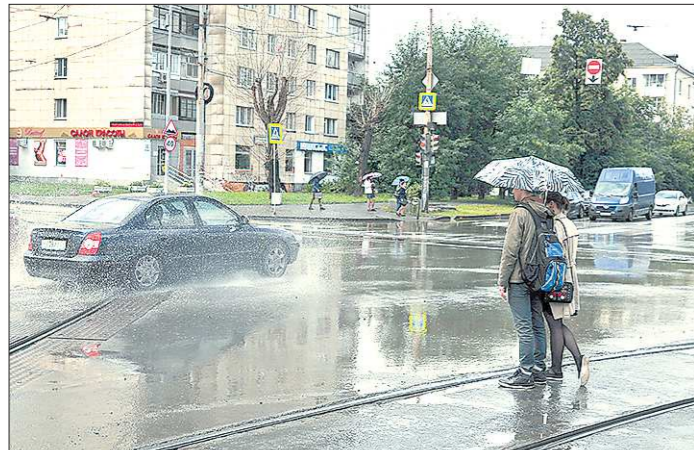
В течение текущей рабочей недели под влиянием циклонов и атмосферных фронтов на Урале будет очень ветрено и сыро

логию всегда очень сложно найти. Погода не повторяется, каждый год она разная и преподносит неожиданные сюрпризы. В то же время в Екатеринбурге среднемесячная температура в мае всего на один градус ниже нормы. И осадков в мае выпало в пределах нормы. Характерная особенность нынешнего мая в том, что не произошло нарастание тепла во второй половине месяца, как это обычно бывает. Кроме того, часто бывают заморозки. Поэтому в этом году аграрии на Среднем Урале поздно начали сельскохозяйственные работы. А кроме того, и потому, что земля, как говорится, вовремя не поспела. Зима была малоснежная, и почва промерзла глубже, чем обычно, очень долго оттаивала. Влага застаивалась. Поэтому есть серьёзные опасения по поводу того, успеет ли этим летом созреть урожай.