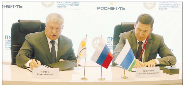
Документ, который подписали губернатор Евгений Куйвашев (справа) и президент Роснефти Игорь Сечин открывает новые перспективы газификации муниципалитетов

Глава региона и президент компании «Роснефть» Игорь Сечин договорились о развитии двусторонних партнёрских отношений. Документ закрепил намерения