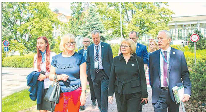
Депутаты Заксобрания побывали в реабилитационном центре краевой больницы Южночешского края в городе Ческе-Будевице, где ознакомились с технологиями, применяющимися для реабилитации больных в послеоперационный период и для лечения неврологических заболеваний