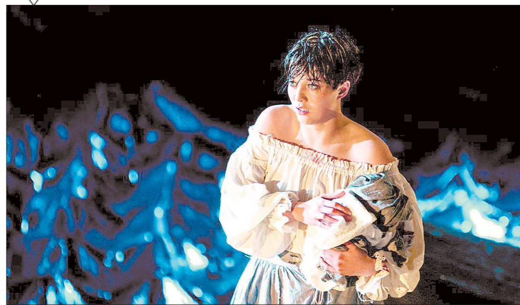
Представляем одну из самых ярких работ областного театрального фестиваля «Браво!» — спектакль «Сучилища» Серовского театра драмы им А.П. Чехова

«Серовский театр перевербовал зрителя» www.oblgazeta.ru