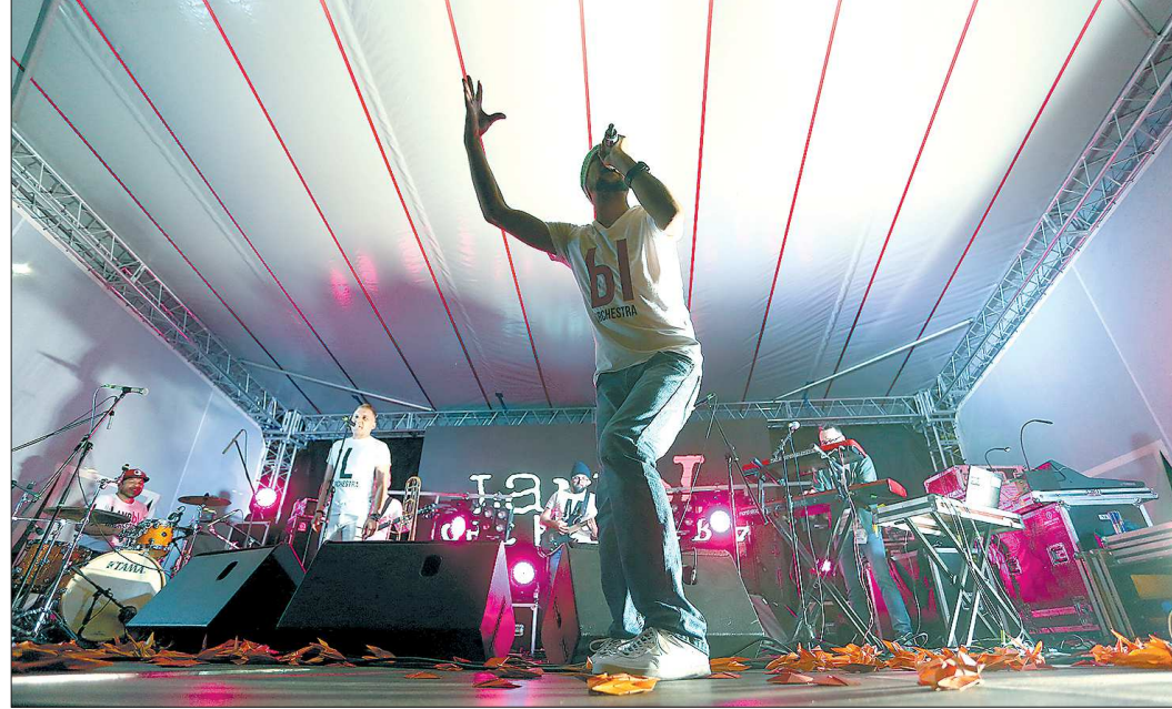
Раз в год Екатеринбург точно превращается в музыкальную столицу. Этого праздника ждут как меломаны, так и сами музыканты, готовые без устали играть всю ночь

Готовим программу из произведений русских и зарубежных композиторов, – рассказывает корреспонденту «ОГ» начальник музыкального от-