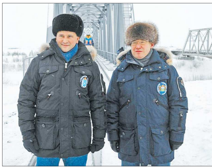
Дмитрий Кобылкин (слева) возглавил ЯНАО в 2010 году, Владимир Якушев возглавил Тюменскую область в 2005 году

Выборы губернаторов Тюменской области и ЯНАО будут назначены на 9 сентября текущего года.