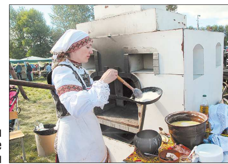
В уличной печи можно даже печь блины