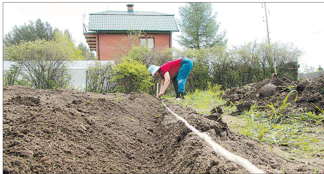
Перед тем как садить картошку, лучше натянуть шнур, чтобы были ровные гряды

В зависимости от сорта, конкретного участка эти параметры могут варьироваться. Если говорить об общепринятой методике, то обычно рекомендуется высаживать картофель на расстоянии 75 сантиметров между рядами, а меж-