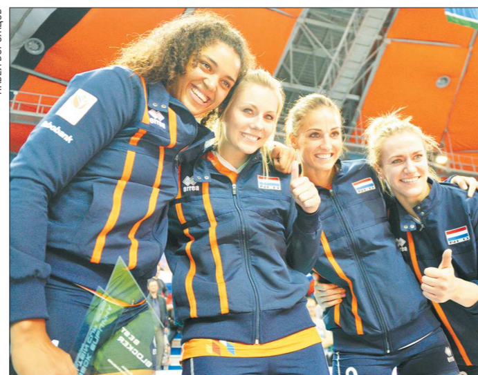
Солнечные улыбки девушек из «оранжевой» команды Нидерландов