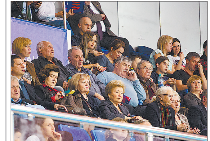
На стартовом матче международного волейбольного Кубка Бориса Ельцина, игры которого идут также в зачёт Лиги наций, присутствовали председатель Законодательного собрания Свердловской области Людмила Бабушкина и вдова первого Президента России Нина Ельцина. Сборная России обыграла Аргентину – 3:1