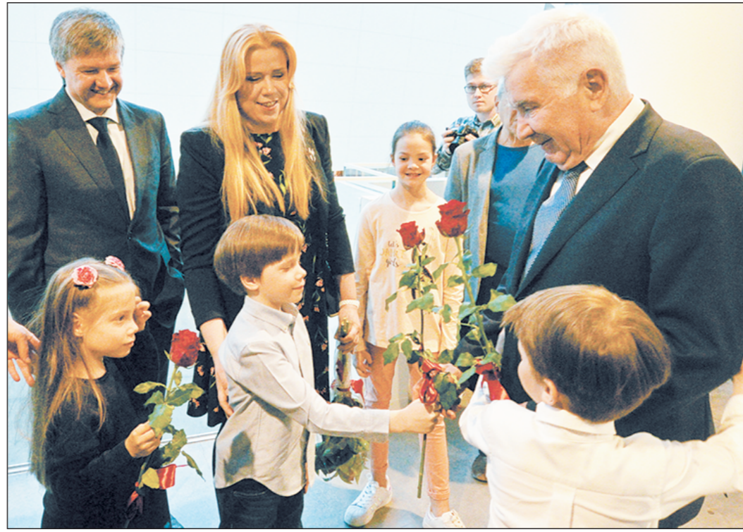
Цветы патриарху волейбола от самых юных болельщиков