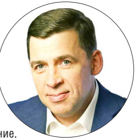
ДЕПАРТАМЕНТ ИНФОРМАТИКИ СО

Сегодня всё мировое сообщество отмечает Международный день медицинской сестры. Датой праздника было выбрано 12 мая – день рождения Флоренс Найтингейл – одной из основоположниц службы сестёр милосердия.