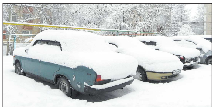
В Серове в ночь на понедельник, 23 апреля, выпало около 30 сантиметров снега