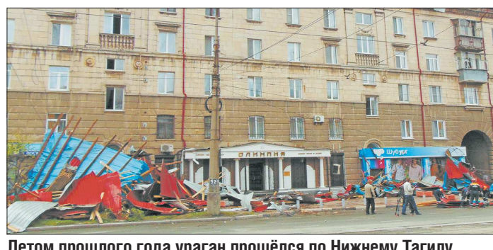
Летом прошлого года ураган прошёл по Нижнему Тагилу. Скорость ветра достигала 25 м/с. Стихия накрыла регион после шторма в Москве, в результате которого погибли 18 человек