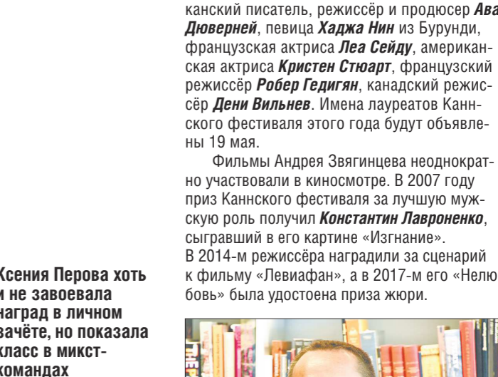
Также Андрей Звягинцев имеет награды премии «Золотой орёл», «Ника», «Сезар» и Венецианского кинофестиваля