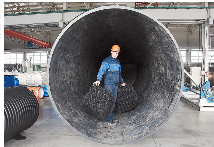
На заводе «Уникон» инженеры познакомились с изготовлением полнотелых резервуаров, заготовкой для которых служат ёмкости, где человек может передвигаться в полный рост

Разработка нового оборудования и усовершенствование методов работы — неотъемлемая часть деятельности большинства наших предприятий. Но у них впереди новый, качественный скачок — цифровизация предполагает узкую специализацию и повышение производительности на каждом этапе изготовления изделия.