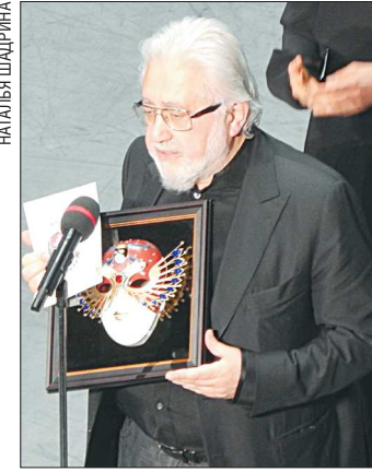
Лев Додин получил самую престижную «Маску» – за лучший драматический спектакль большой формы