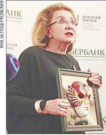
Алла Демидова стала лучшей актрисой в драматическом театре. Зал приветствовал её стоя