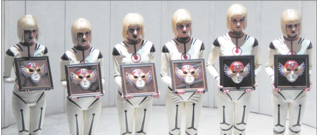
В этом году тема фестиваля – «Будущее», поэтому награды «Золотой маски» на сцену выносили нано-помощники

В Москве на Новой сцене Большого театра завершилась церемония вручения 24-й российской национальной театральной премии «Золотая маска». В Екатеринбурге в этот раз отправляется четыре «Маски»: две – у спектакля екатеринбургского Оперного театра «Пассажирка», одна – у оперетты Мукомедии «Микадо» и одна – у балета «Имаго-ловушка» «Провинциальных танцев». Журналисты «Областной газеты» находились на месте событий и делятся первыми впечатлениями лауреатов.