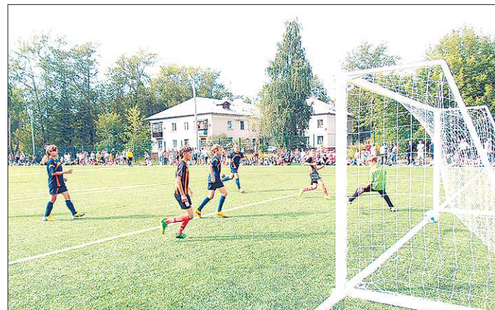
Пока в Горнозаводском округе хороший стадион для занятий футболом — редкость. Но в инфраструктуру всё чаще готовы вкладываться частные лица. Так, благодаря футболисту Олегу Шатову появился стадион в посёлке Рудник имени III Интернационала

Отделение футбола в «Спутнике» — совсем молодое. Раньше все вагонские мальчишки грезили хоккеем, а с 2012 года 300 ребят подружились с мячом. Непростые условия для занятий их не останавливают. В активе тагильских команд — победы в региональных турнирах, а тренеров школы областная федерация