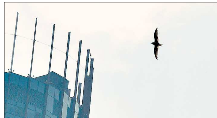
В апреле в небе над Екатеринбургом можно увидеть одиночек стрелов и орланов-белохвостов, которые возвращаются домой с зимовья из Средней Азии