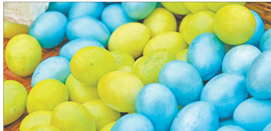
Зелеными и голубыми яйца можно сделать не только с помощью специальных красителей, но и с помощью шпината и черники

Впрочем, крашеные яйца и куличи — лишь незначи-