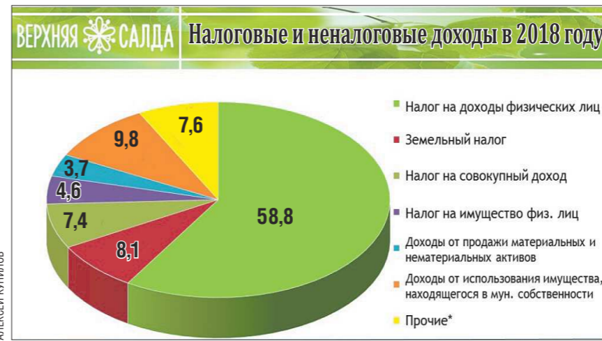
Верхняя Салда. Налоговые и неналоговые доходы в 2018 году

НДФЛ составляет почти половину налоговых поступлений в бюджет муниципалитета.