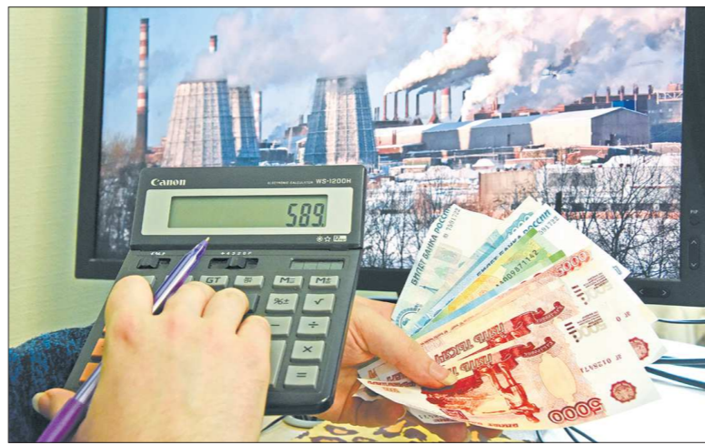
Налоги на доходы физических лиц — главная статья доходов в муниципальных бюджетах

Только исполнением налоговых обязательств производственных не ограничиваются. Пожертвования на развитие объектов весьма значительны. Например, в прошлом году 95 миллионов рублей УТМК направила на ремонт Дворца культуры и школ. Ныне на ремонт учебных заведений выделяется 40 миллионов рублей. Завод твёрдых сплавов тоже направляет по 7 милли-