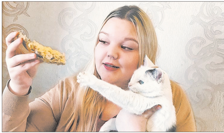
Маша против «фальшивости» в Instagram, она признаётся, что даже косметикой старается пользоваться по-минимуму