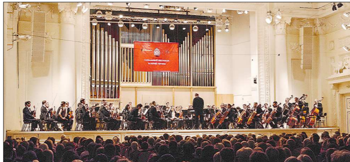
В прошлом году Свердловскую филармонию посетили около 500 тысяч человек

Сейчас в Свердловской области 33 виртуальных музея. В течение текущего года появятся ещё три таких музея. Но ключевым проектом в данном направлении, широко известным и признанным даже на международном уровне,