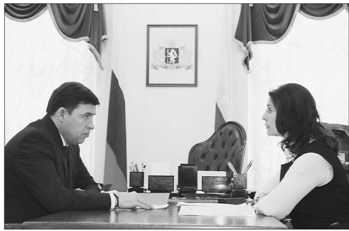
ДЕПАРТАМЕНТ ИНФОРМАТИКИ СВЕРДЛОВСКОЙ ОБЛАСТИ