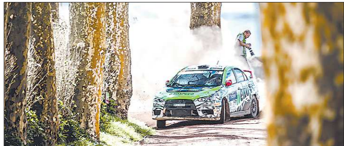
ПРЕДСТАВЛЕНИЕ СЕРГЕЕМ РЕМЕННИКОМ

Сергей Ременник и Марк Розин выступают на чемпионате Европы на Mitsubishi Lancer Evolution