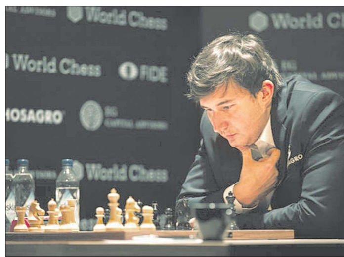
Сергей Карякин не сумел во второй раз подряд выиграть Турнир претендентов

— Он проиграл две партии белыми! Это говорит о том, что он очень хотел вы-