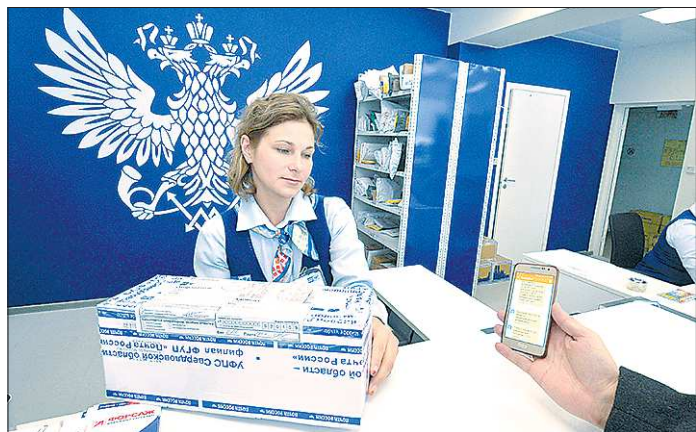
Чтобы получить посылку, нужно показать оператору СМС с кодом

Электронная очередь, видеомониторинг, почтаматы и удобные услуги для бизнеса — Почта России в Екатеринбурге становится современной и удобной. Корреспондент «ОГ» проехал по передовым отделениям уральской столицы и убедился, что теперь получить и отправить корреспонденцию можно быстрее и легче.