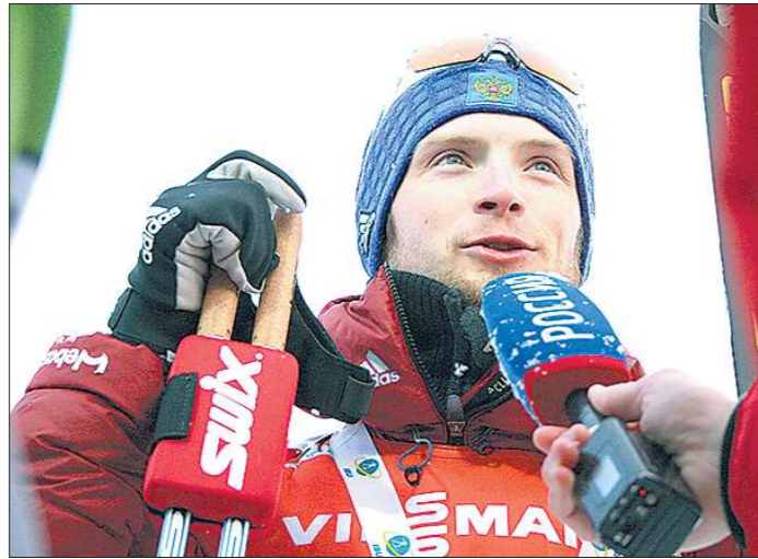
Максим Цветков одержал первую в карьере победу в личных гонках на этапах Кубка мира по биатлону

В Тюмени завершился последний этап Кубка мира. Все Большие и Малые хрустальные глобусы нашли своих обладателей, биатлон ушёл на заслуженный перерыв. Журналисты «ОГ» побывали на «Жемчужине Сибири», увидели своими глазами триумф Мартена Фуркада и Кайсы Мякярйянен и оценили уровень организации российского этапа.