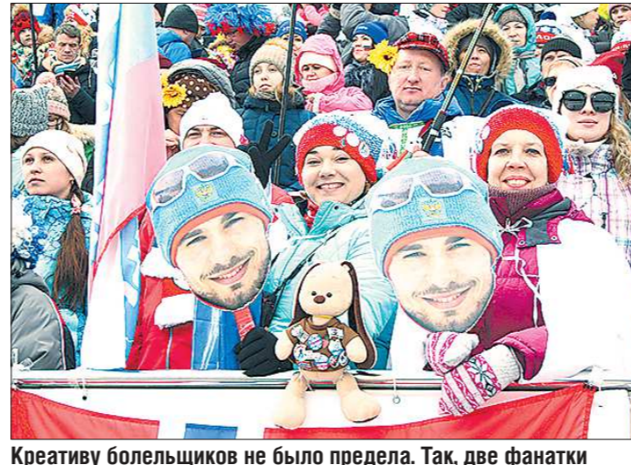
Креативу болельщиков не было предела. Так, две фанатки Антона Шипулина решили поддержать биатлониста его же портретом