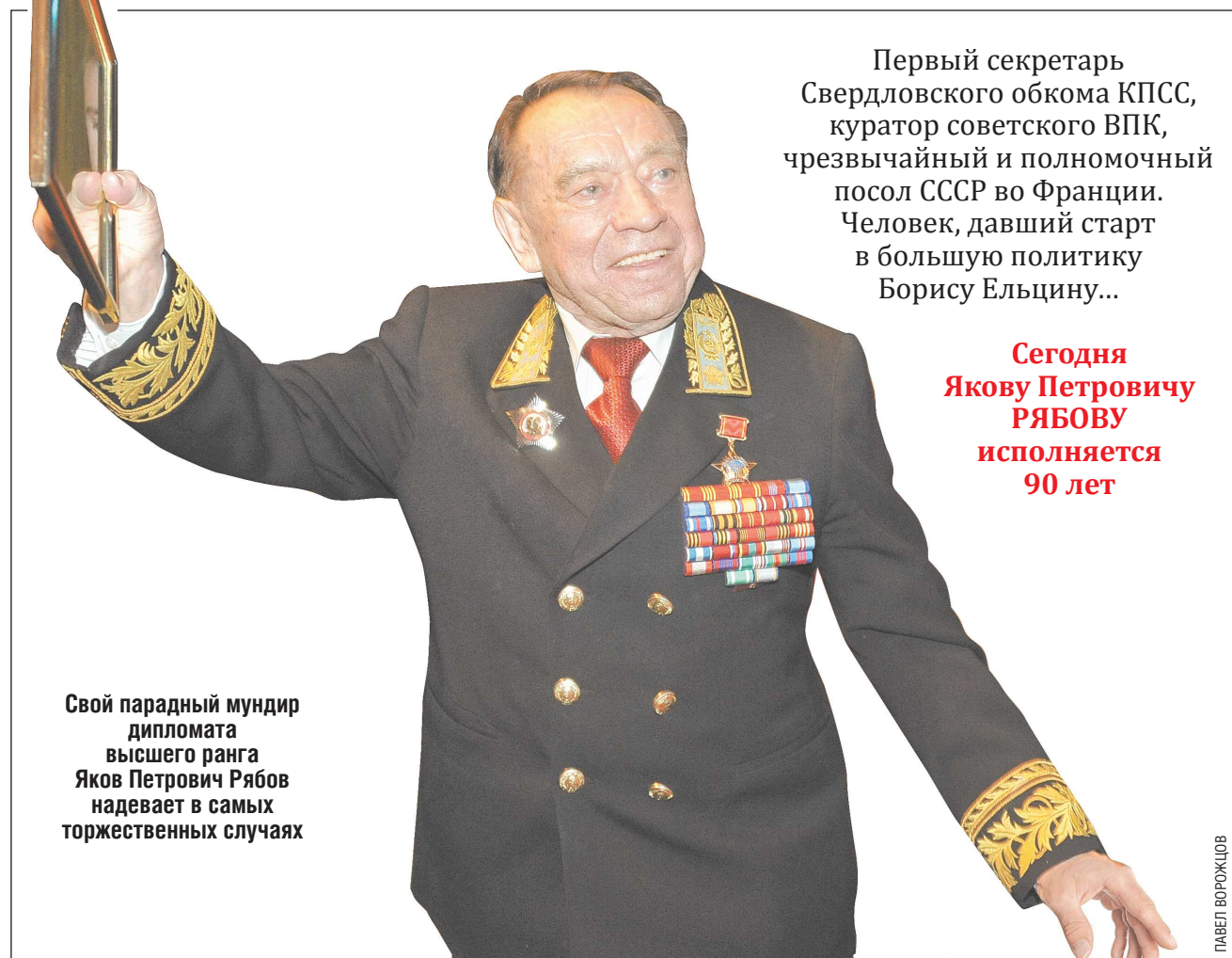
Свой парадный мундир дипломата высшего ранга Яков Петрович Рябов надевает в самых торжественных случаях