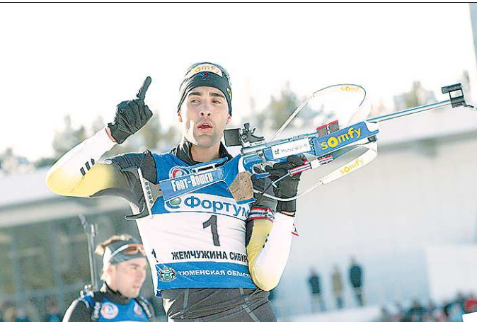
Главная звезда мирового биатлона Мартен Фуркад уже приезжал в Тюмень несколько раз и знаком со вкусом побед на «Жемчужине Сибири»