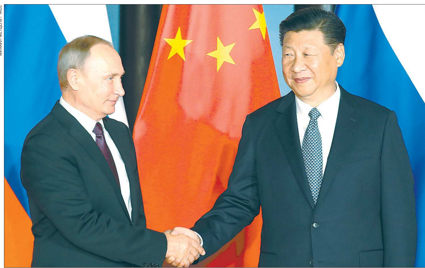
Президент России Владимир Путин и председатель КНР Си Цзиньпин синхронно переизбрались на новый срок. Доброй традицией стали встречи лидеров двух стран. По итогам одной из таких встреч главы государств объявили 2018-й и 2019-й годами российско-китайского межрегионального сотрудничества. Это должно способствовать развитию и укреплению взаимодействия между странами на местном уровне

Пока атлантические державы ссорятся с Россией, сотрудничество нашей страны с Китаем выходит на новый уровень. Как заявил вчера глава Госсовета Китая Ли Кэцян, товарооборот между странами должен увеличиться до 100 млрд долларов. Множится число китайских туристов — сегодня Поднебесная занимает первое место по росту въездного туризма в Россию. О том, как будут развиваться отношения между странами, на примере нашего региона рассказала Генконсул КНР в Екатеринбурге госпожа Гэн Липин