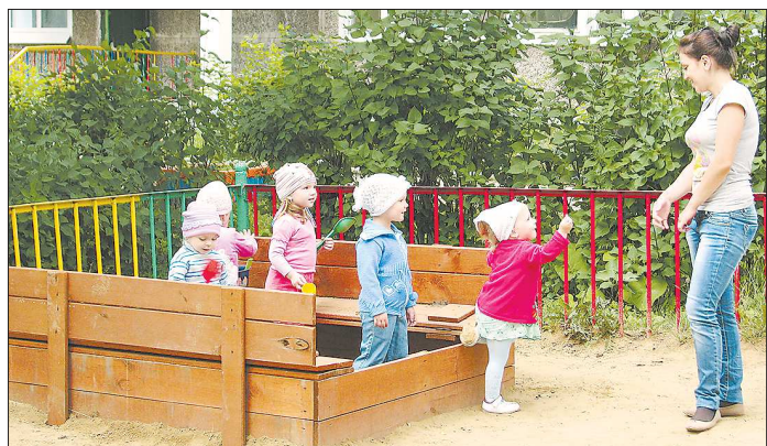
Почти три тысячи детей ждут очереди в ясли в Нижнем Тагиле