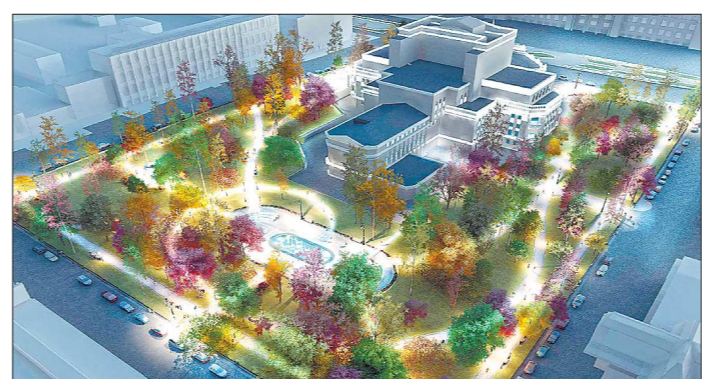
За проект реконструкции сквера у здания Оперного театра в Екатеринбурге проголосовали почти 54,5 тысячи горожан

В воскресенье в 47 муниципалитетах области на первом этапе голосования выбрали общественные территории для благоустройства. На обработку бюллетеней отвели неделю, но муниципалитеты вовсю оглашают итоги и сообщают, что уже сделано по проектам-победителям. В большинстве случаев мэрия уже вынашивала проекты реконструкции этих территорий — жители поддержали эти намерения.