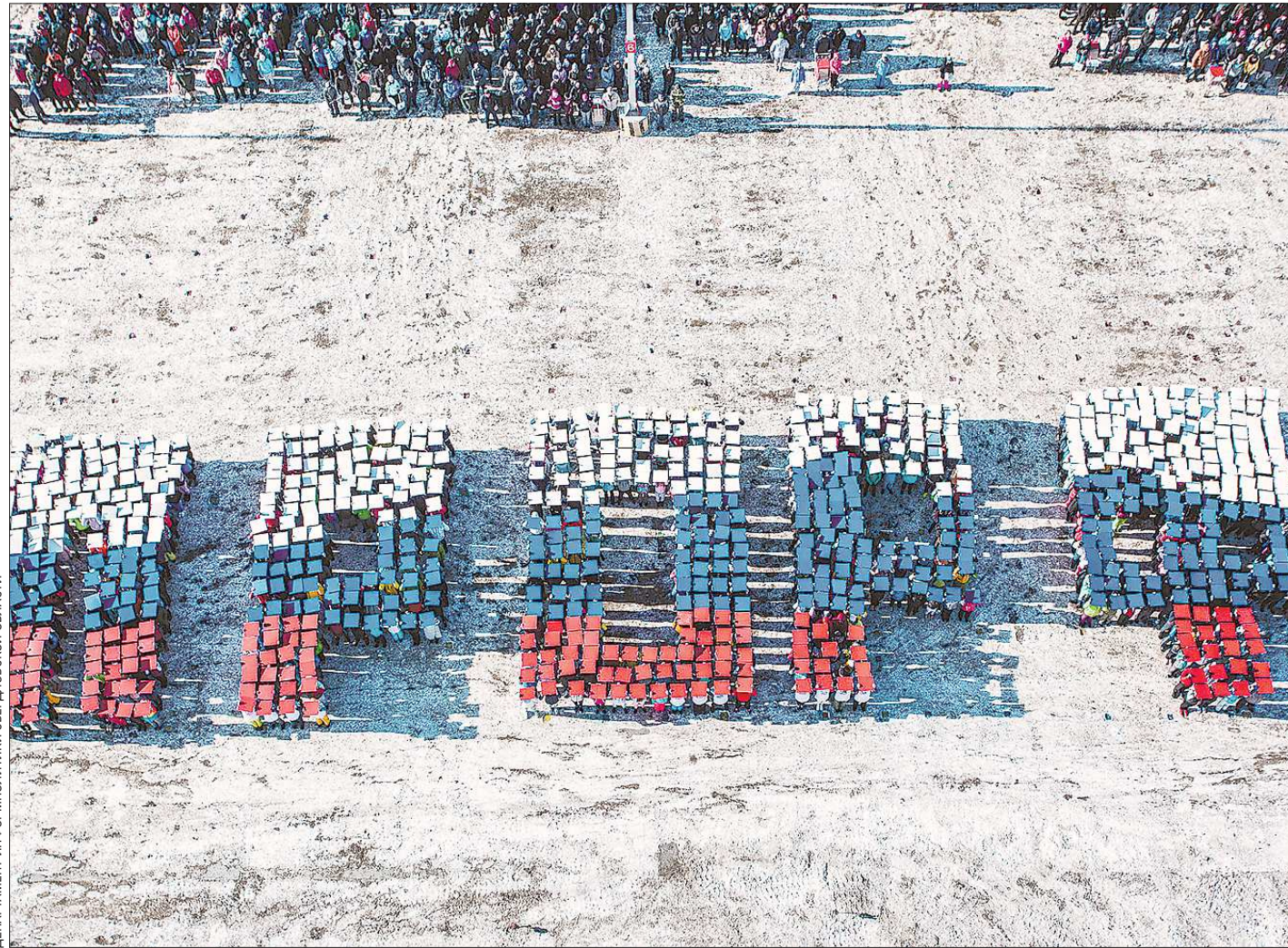
ДЕПАРТАМЕНТ ИНФОРМАТИКИ СВЕРДЛОВСКОЙ ОБЛАСТИ