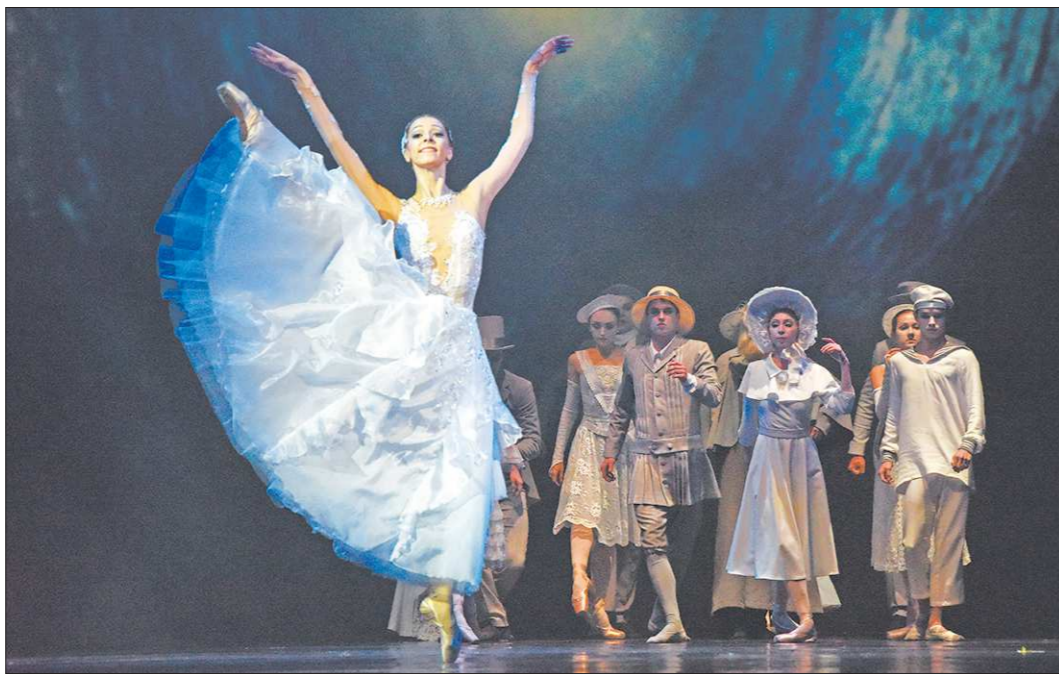
Порой складывается так, что в платьях в театре оказываются лишь артистки

— Если сравнивать с советским временем, когда в те-