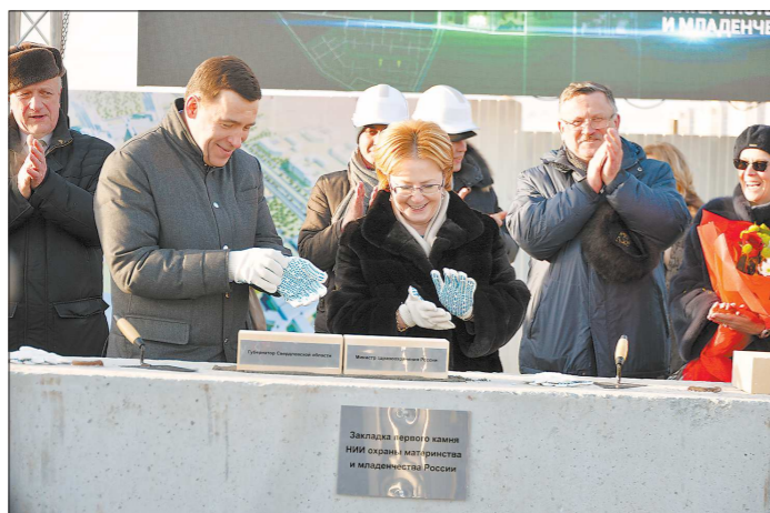
Вероника Скворцова и Евгений Куйвашев дали старт уникальному медицинскому проекту

Стоит отметить, что в России хирургическое внутриутробное лечение проводят только в НИИ ОММ. В прошлом году высококвалифицированную помощь здесь получили 13,7 тысячи пациентов из группы высокого риска. Врачи научились выхаживать малышей, которые появились на свет значительно раньше положенного срока с массой тела меньше одного килограмма. С каждым годом процент выживаемости таких пациентов растёт. Между тем само здание института в центре Екатеринбурга давно перестало отвечать современным требованиям. Поэтому и было приня-