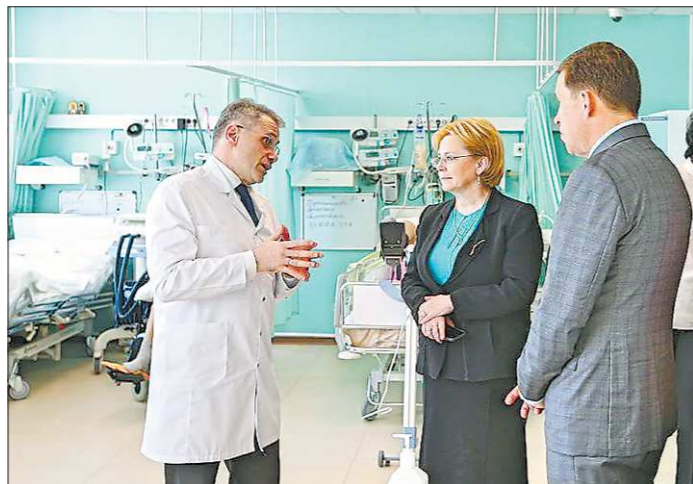
Визит главы Минздрава РФ Вероники Скворцовой в Свердловскую область начался с осмотра Клинического института мозга в Берёзовском. Министр здравоохранения РФ и губернатор Евгений Куйвашев осмотрели медицинское учреждение, признанное Минздравом экспертным центром по реабилитации после инсультов

Вероника Игоревна похвалила всех сотрудников НИИ ОММ с тем, что они получат новый замечательный комплекс, в котором будет стационар более чем на двести коек, консультативно-диагностический центр для взрослых, отделение катанетического наблюдения и восстановительного лечения для малышей и, конечно, вся необходимая хозяйственная инфраструктура. И безусловно, что это, одно из крупнейших в России, научное и лечебное акушерско-гинекологическое учреждение, будет оснащено самым современным медицинским оборудованием.