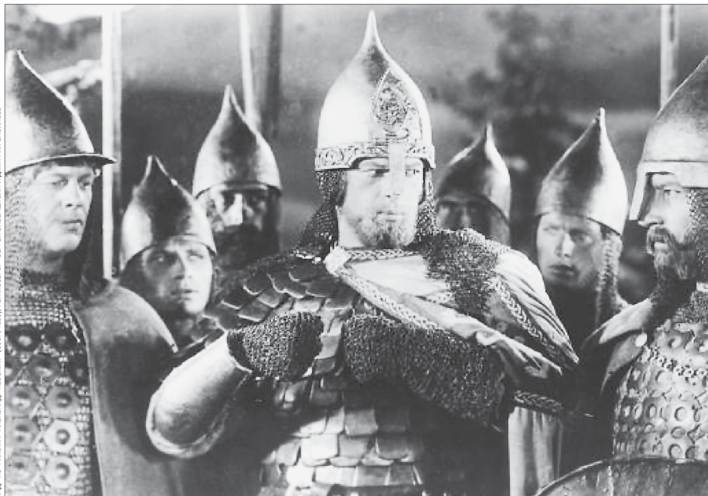
КАДР ИЗ ФИЛЬМА «АЛЕКСАНДР НЕВСКИЙ» (СССР, 1988). РЕЖИСЁРЫ — СЕРГЕЙ АЙЗЕНШТЕЙН И ДМИТРИЙ ВАСИЛЬЕВ