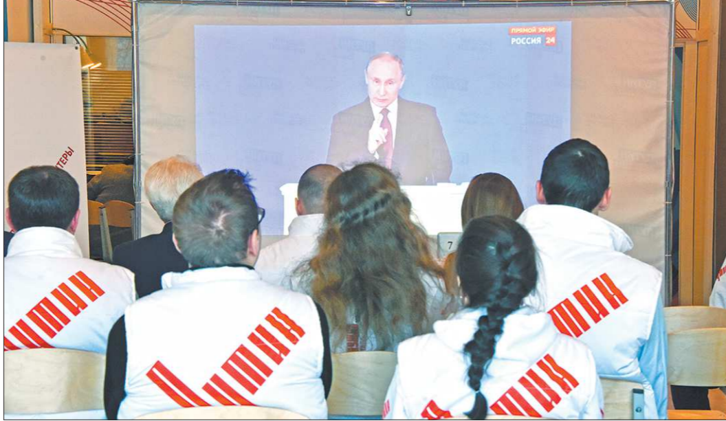
Послание транслировали в избирательном штабе Владимира Путина в Екатеринбурге

Вчера Президент России Владимир Путин выступил перед Федеральным Собранием с Посланием, где обозначил положение дел в стране и основные стратегические направления развития на ближайшую перспективу.