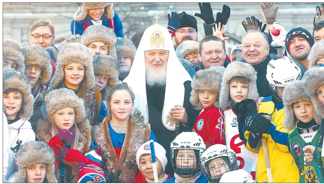
Если позволяет плотный график, Патриарх Кирилл приезжает пообщаться с юными хоккеистами

Ответная игра с «Заречье-Одинцово» пройдёт 5 марта на площадке гостей.