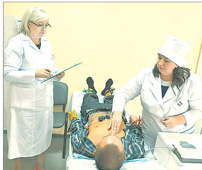
По данным Росстата, в 2017 году одним из самых недостающих специалистов для консультации в России оказались кардиологи и эндокринологи

— Какое-то время у нас за кардиолога работал терапевт, но есть требования обязательного наличия у врача сертификата кардиолога. Население в прошлом