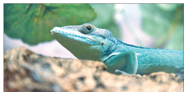
Самый крупный из поступивших гекконов — анолис-рыцарь